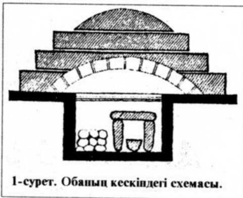
1-сурет. Обаның кескіпдегі схемасы.

Алғашқы қазылған обаның диаметрі 34,4 м., биіктігі 1,70 м. Оба үйіндісінің сыртқы көрінісі сопақша формалы болып, үйіндінің ортасына таманғы тұсы төмен қарай отырып кеткен. Ескерткіштің жер бетіндегі құрлысының негізі - алдын ала дайындалған алаңда обаның ортасынан бастап ірі жалпақ тастарды қара топырақпен шығыздай отырып төсеп жасаған платформадан (тағандық) тұрады. Оба үйіндісінің етегі ірі тақта тастармен бірнеше қатар етіліп қаланып тиянақталған, ал оның арасы ұсақ тақта және малта тастармен төмгеріле жабылған (1 сурет). Обаны қазып 2,70-4,05